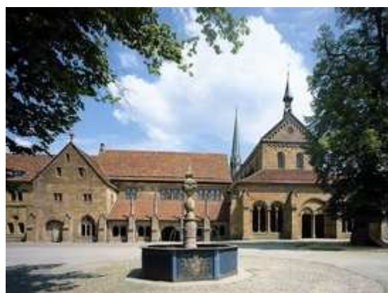
Kloster Maulbronn

Das 1993 zum Unesco-Weltkulturerbe ernannte Kloster hat die Kultur- und Klosterstadt Maulbronn rund um den Erdball bekannt gemacht. Rund 300.000 Touristen besuchen jedes Jahr die Klosterstadt. Hier legen wir einen mindestens 2-stündigen Aufenthalt ein. Bis zur Einstellung des öffentlichen Schienenpersonenverkehrs am 2. Juni 1973 waren übrigens Schienenbusse auf der Strecke von Maulbronn West nach Maulbronn Stadt planmäßig unterwegs. Nach jahrelanger Betriebsruhe fährt auf dieser Strecke zwischenzeitlich an Wochenenden von Mai bis Oktober jeden Jahres der sogenannte „Klosterstadtdress“.