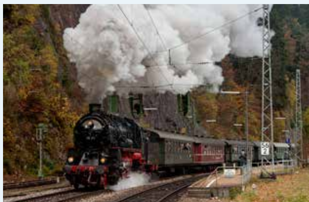
58 311 (UEF) in Triberg.