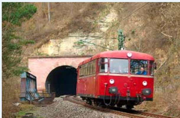
796 625 beim Rottweiler Au-Tunnel.