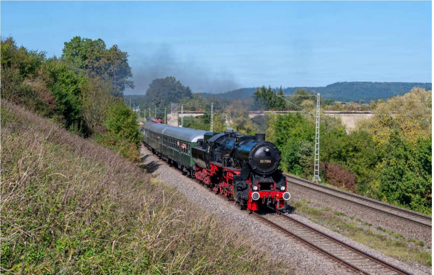
52 7596 am 01. Oktober 2023 mit einem EFZ-Sonderzug zwischen Rottweil und Schwenningen

Veranstaltungen der Eisenbahnfreunde Zollernbahn e.V. (EFZ)